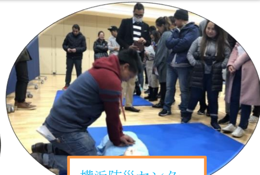
横浜防災センター