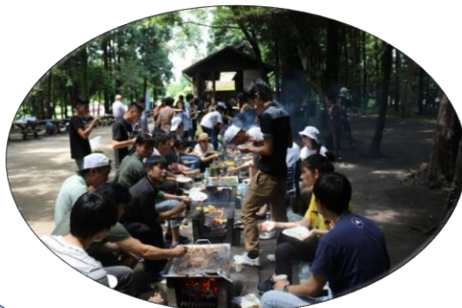
バーベキュー：泉の森キャンプ場